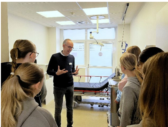
Abbildung 2: Einblick in die Notaufnahme