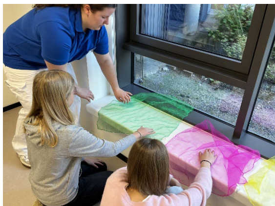
Abbildung 4: Geschicklichkeitsübung in der Physiotherapie