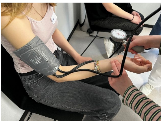
Abbildung 3: Blutdruckmessung