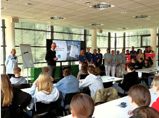
Abbildung 1: Begrüßung und Teamvorstellung