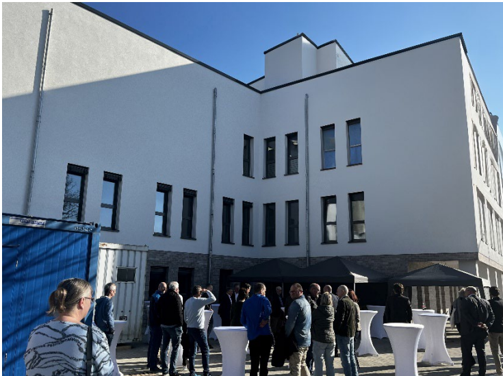
Abbildung 2: Außenansicht Mathias-Bonse-Haus