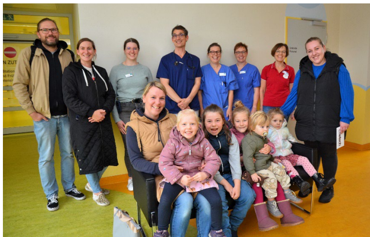
Abbildung 1: Alle Gewinner des Luftballonwettbewerbs mit ihren Familien sowie Vertretern der Klinik für Kinder- und Jugendmedizin am Klinikum Rheine und des Vereins Bunter Kreis e.V.