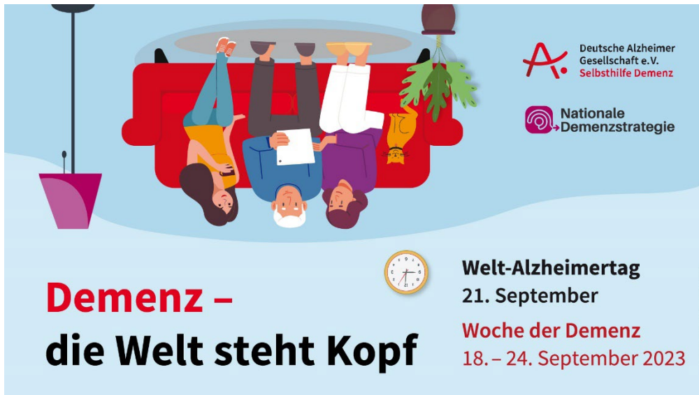
Abbildung 2: Das Motto für den Welt-Alzheimerstag und die Woche der Demenz lautet: „Demenz – die Welt steht Kopf“